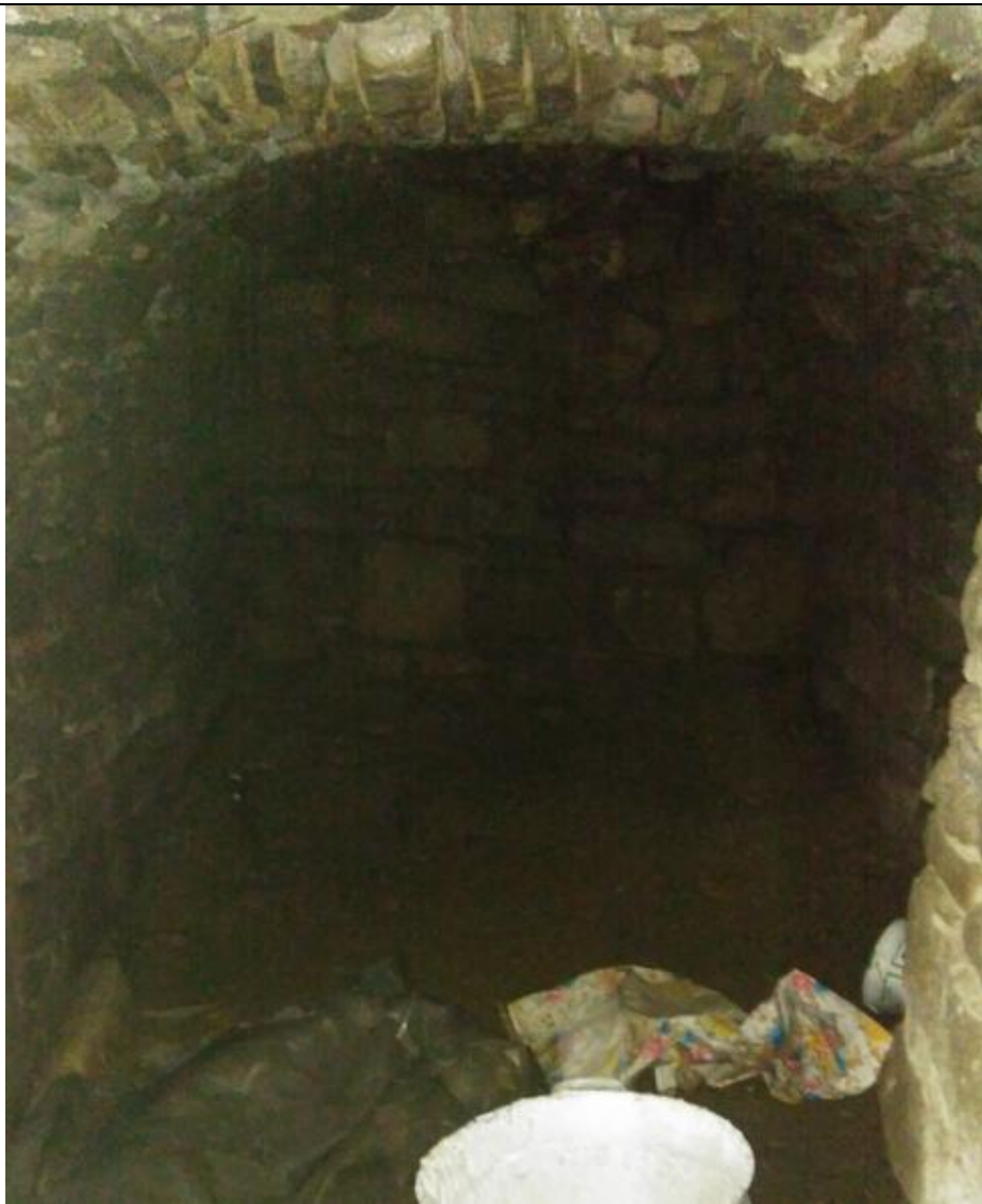
SCHODY DO PIWNICY